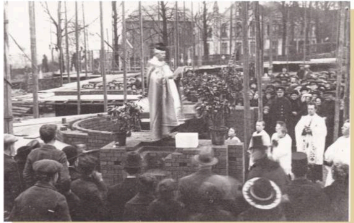
Op 31 maart 1921 vindt onder grote belangstelling de plechtige eerste steenlegging plaats.

De aanvulling op de benodigde gelden komt uit de 'kerkpenning'. Iedere zondag bezoeken tientallen zelatrices elk huisgezin, arm en rijk, om de bijdrage te innen. Gegoede parochianen krijgen om de twee maanden een speciale collectant aan de deur. Andere bronnen van inkomsten zijn giften en de verkoop van grond. Verder verlenen de parochianen hand- en spandiensten bij de bouw. Zo'n 1¼ miljoen uit Kleef afkomstige stenen vervoeren boeren met paard en wagen van het station Groesbeek naar het bouwterrein. Een karwei van ruim een half jaar. 'Allen voldeden aan het verzoek, behalve zes boeren op de Plak en drie op de Heikant' , meldt Rovers zuur. Gevoel voor symboliek is hem niet vreemd: op maandag 27 september, de feestdag Cosmas en Damianus, gaat de eerste spade in de grond. De bouwvakkers zijn vooral afkomstig uit het verarmde Duitsland. Groesbekers werken er vanwege hogere lonen elders, betrekkelijk weinig. Rovers spoort zijn parochianen aan de bouw van de kerk met gebed geestelijk te steunen en elke avond na het rozenkransgebed een extra Onze Vader en Wees Gegroet te bidden 'teneinde van God te verkrijgen, dat er geen ongelukken tijdens de bouw zouden geschieden.' Of dat heeft geholpen leest u de volgende keer.